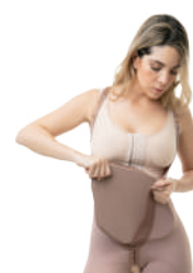
8913 REALCE INVISIBLE