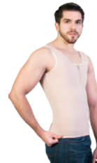
4913 CHALECO CORRECTOR GALESS