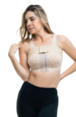
5203 BODY KIMBERLY