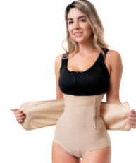
3912 POST PARTO CORTA